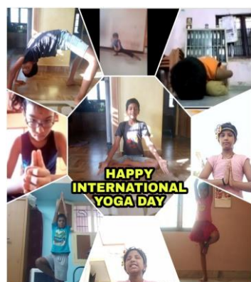
HAPPY INTERNATIONAL YOGA DAY