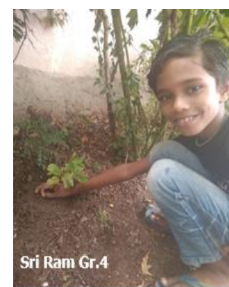
Sri Ram Gr.4